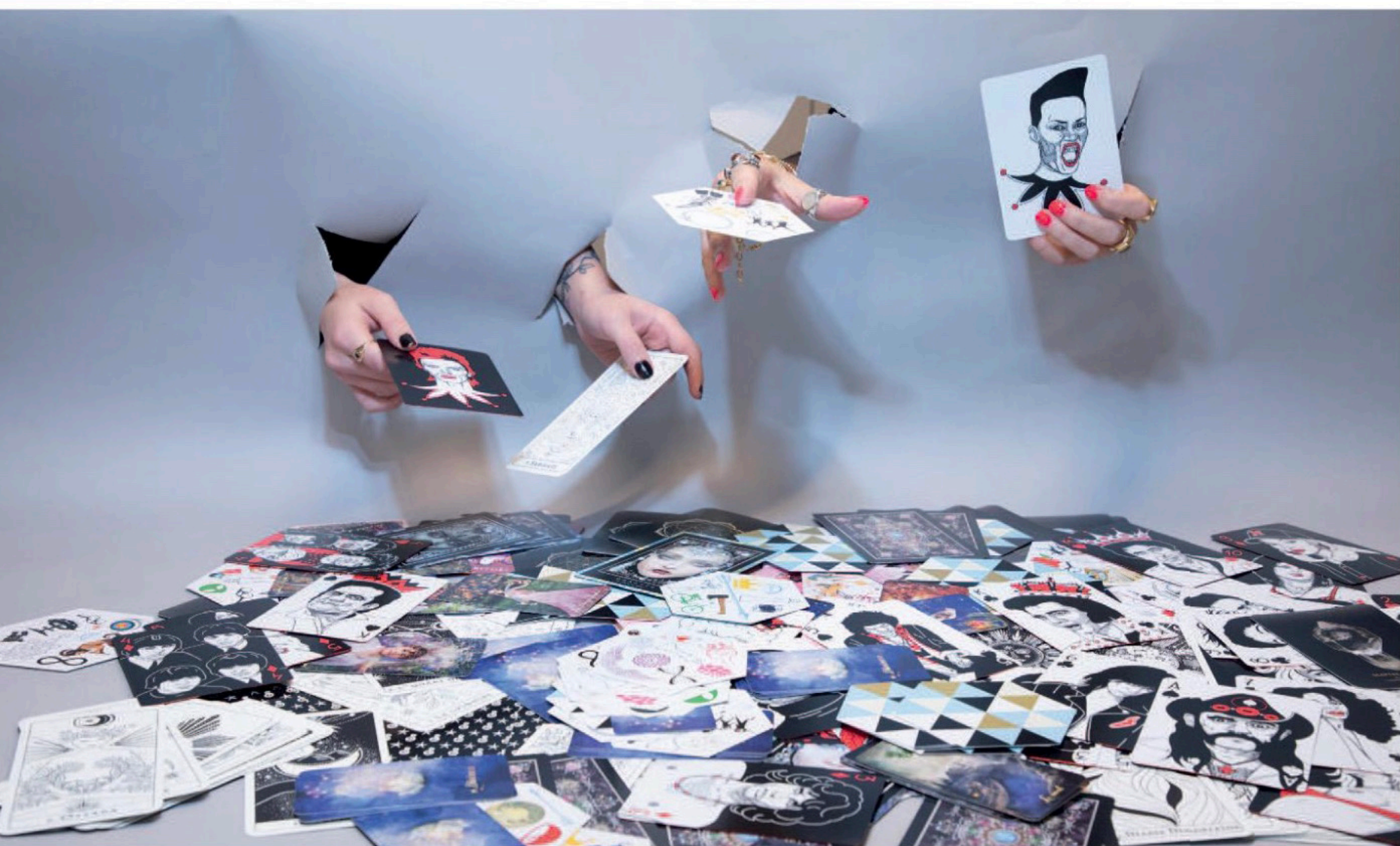
Bataille de cartes d'oracles.